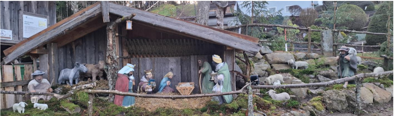
Text- & Fotoquelle: Mühlenverein, Obfrau Monika Krump

Nach vielen Wochen Vorbereitung und zahlreichen freiwilligen Arbeitsstunden konnten wir am 1. Adventwochenende wieder unseren traditionellen Reichenthaler Adventmarkt im Mühlendorf abhalten. Zahlreiche Besucher genossen die stimmungsvolle Atmosphäre im Hayrl, das festlich im Lichterglanz erstrahlte.