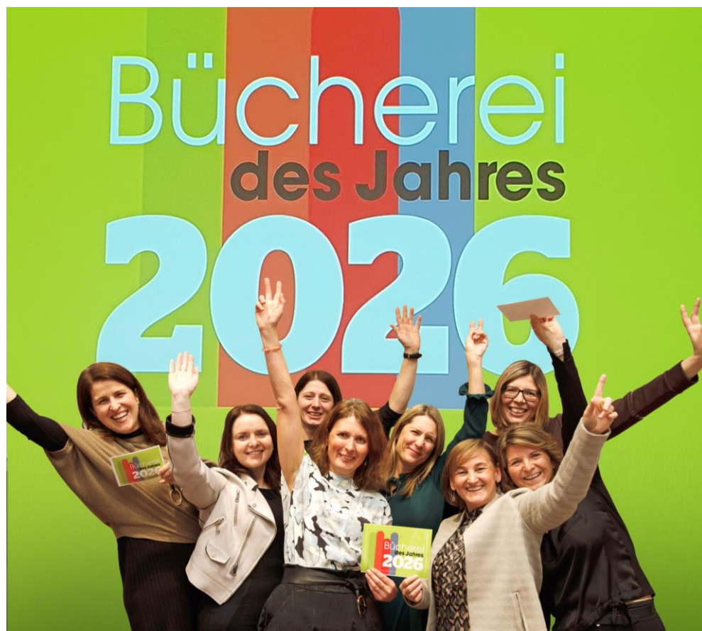
Text: Bücherei Reichenthal