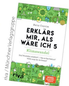
riva / Münchner Verlagsgruppe